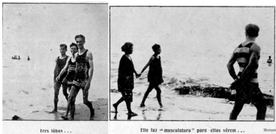
Imagen 1 – Tres lobos...