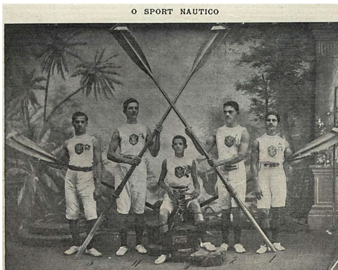
Imagen 3 – Club de Natação e Regatas São Salvador – Bahía

Congreso de Educación Física y Ciencias 16º Argentino, 11º Latinoamericano y 9º Internacional Educación Física por venir. Saberes, prácticas y territorios en disputa