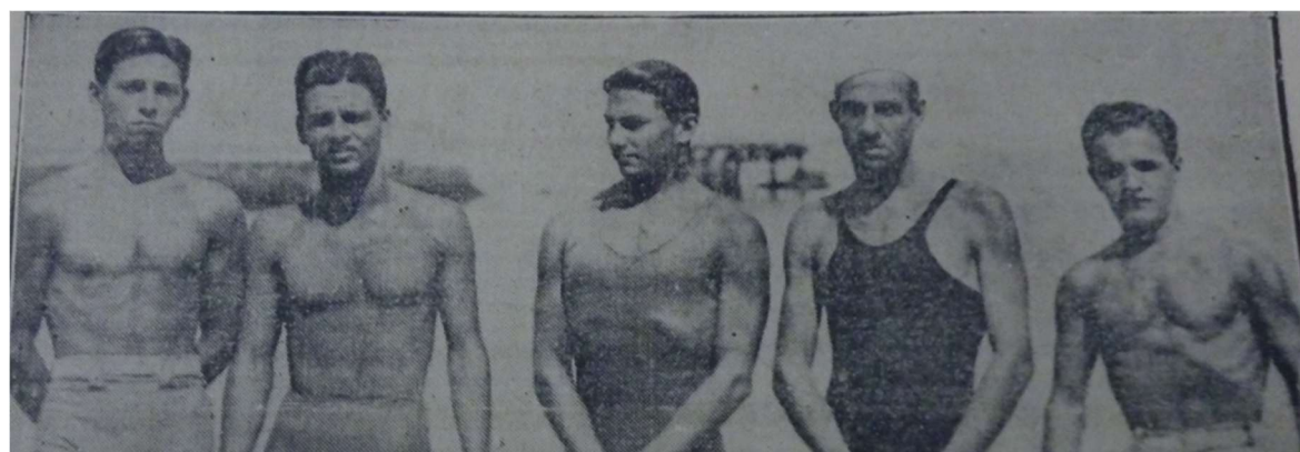
Imagen 4 – Nadadores de Salvador

Congreso de Educación Física y Ciencias 16º Argentino, 11º Latinoamericano y 3º Internacional Educación Física por venir. Saberes, prácticas y territorios en disputa